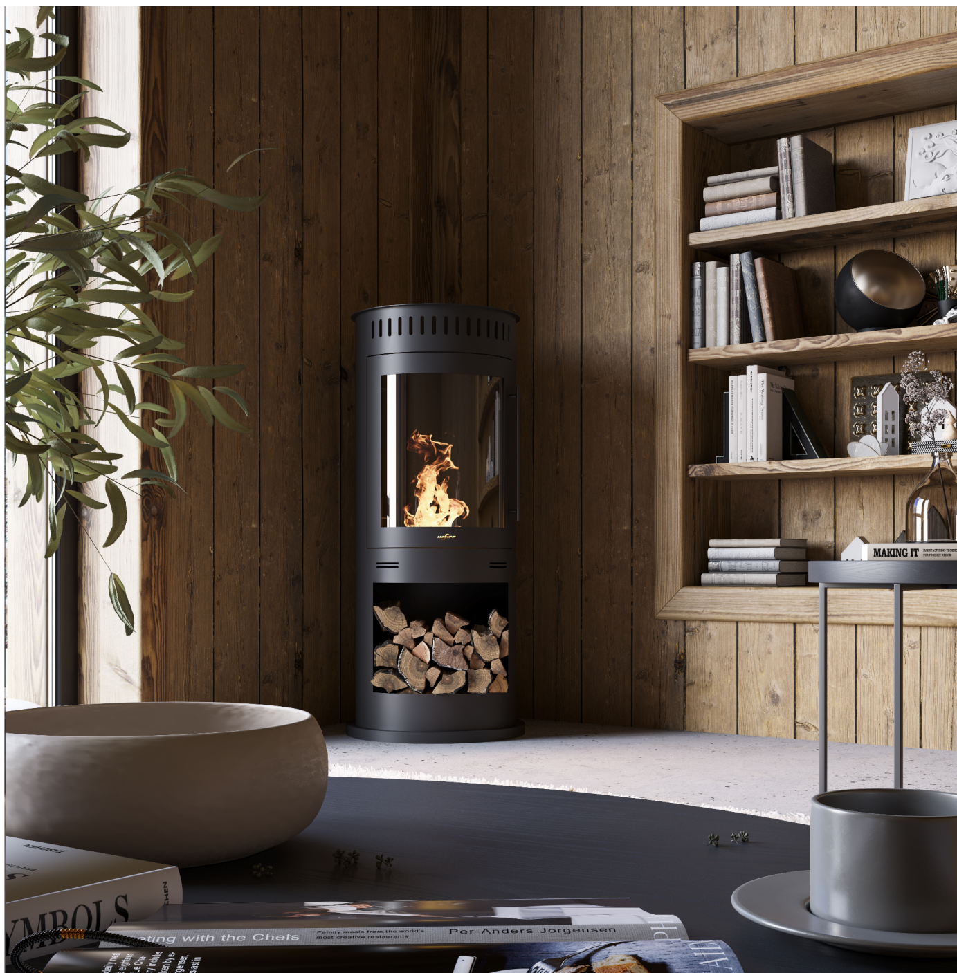
Biokominek Incoza 4